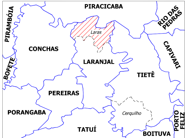
1938 (Anexação de Laras)