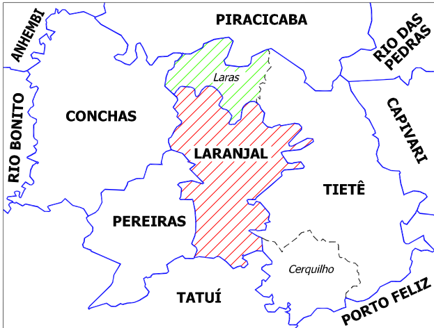
1917 e 1919 (Município de Laranjal e criação de Laras)